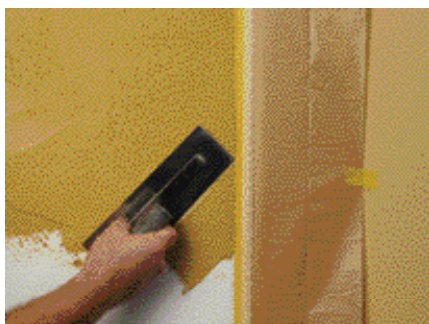
Application de la 2 ème teinte