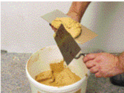
Prendre le mortier