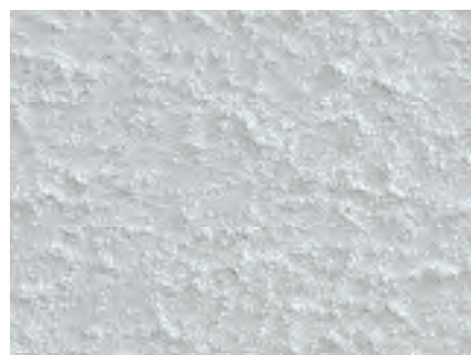
Structure d'une surface en placo-plâtre bien préparée.

Prudence sur des support d'anciennes plaques de plâtre cartonnées, celles-ci peuvent contenir des substances jaunâtres qui réapparaissent sur l'enduit final.