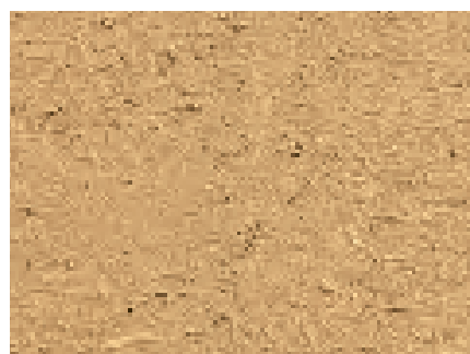
Structure d'une surface bien préparée avec un enduit de base d'argile.