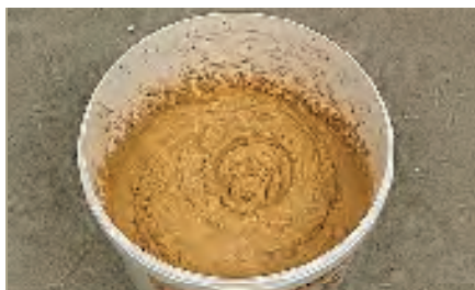
Après 30 minutes, remélanger vigoureusement, la photo montre la consistance du mortier prêt à l'emploi.