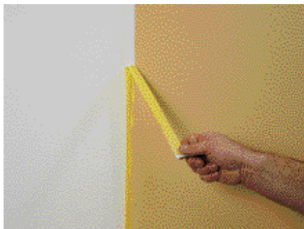
Enlèvement du tape après premier lissage