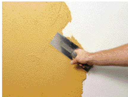
Appliquer avec la taloche