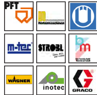
Logos des marques de machines

Le mortier peut aussi être appliqué avec une machine à projeter. Vous trouverez sur notre site internet la liste des marques de machines aptes à cette application. www.claytec.be Les personnes de contact ont testé nos produits avec leurs machines et peuvent ainsi donner tout conseil utile.