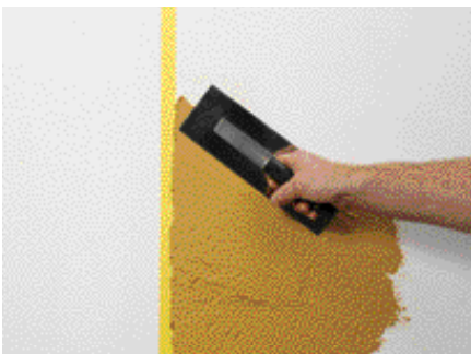
Application de la 1 ère teinte jusqu'au tape

Après séchage complet de cette première surface on la protège de nouveau avec un tape. L'enlèvement sans dégât du tape est à tester avant.