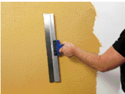
Premier lissage avec le racloir