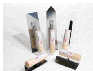
Taloches et lisseuses japonaises, taloches en plastique, outils japonais d'angles