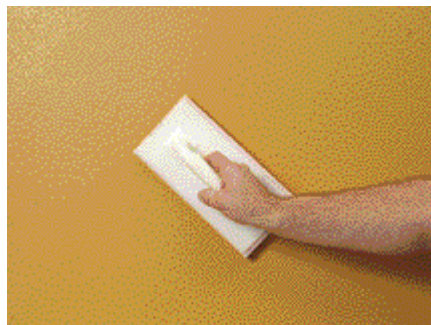
Premier passage avec la taloche éponge