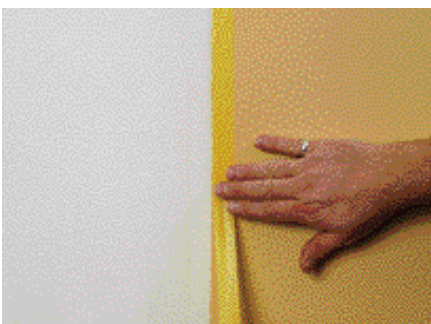
Masquer de nouveau après séchage complet